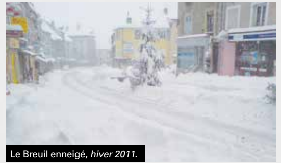
Le Breuil enneigé, hiver 2011.