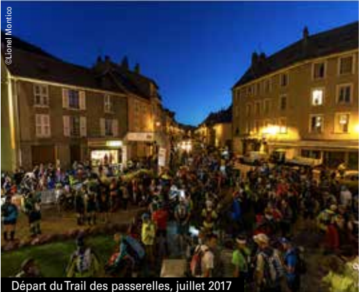
Départ du Trail des passerelles, juillet 2017