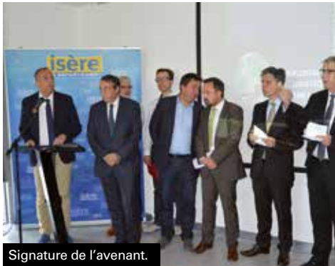
Signature de l'avenant.