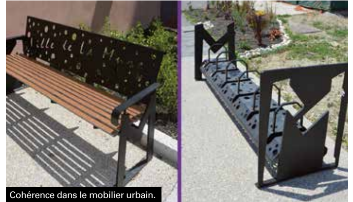
Cohérence dans le mobilier urbain.

L'installation du mobilier urbain continue dans la ville. Pour rester en cohérence avec le style choisi pour les bancs publics, se sont à présent des appuis-vélos qui viennent d'être posés afin de proposer aux cyclistes un matériel adapté sur le domaine public et aux abords de certains équipements.