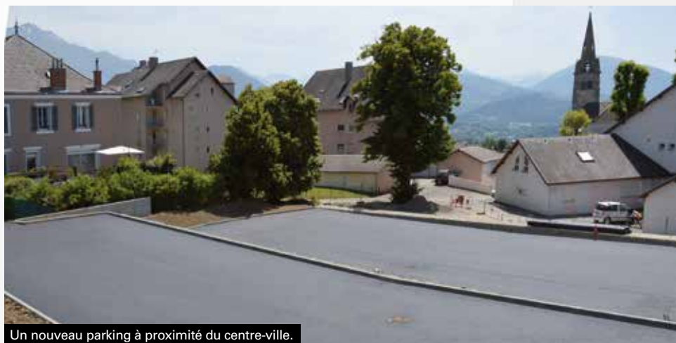
Un nouveau parking à proximité du centre-ville.

Après les fouilles effectuées par l'INRAP à l'automne 2017, l'autorisation a été donnée pour la création d'un nouveau parking Montée de la Citadelle. Cet aménagement était la condition préalable au lancement du grand chantier de la rue du Breuil .