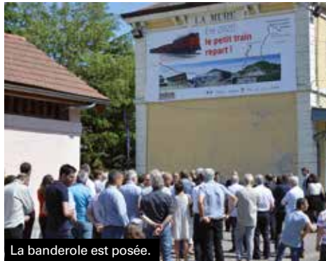
La banderole est posée.

Le 19 juin, une étape cruciale a été franchie pour notre Petit Train. C'est à La Mure, à la Maison du Territoire qu'a eu lieu la signature de l'avenant à la Délégation de Service Public entre le Département et le groupe EDEIS pour la création officielle de la Société du Train de La Mure (STLM).