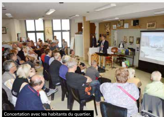
Concertation avec les habitants du quartier.

Les modifications du sens de circulation sur certaines