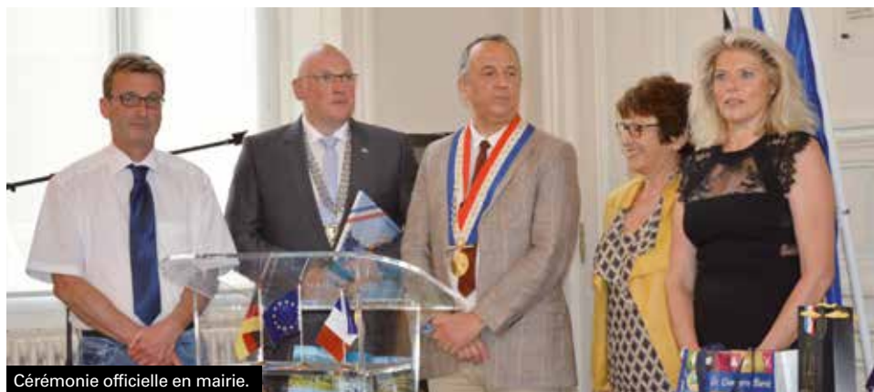
Cérémonie officielle en mairie.