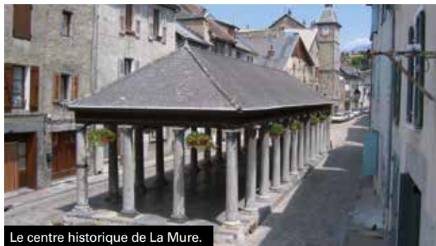
Le centre historique de La Mure.

Le dossier était en préparation depuis un an, la ville de La Mure avait décidé de se lancer dans le projet pour l'obtention du label touristique « Villages-Etapes » attribué par le Ministère de la Transition Ecologique et Solidaire pour les communes qui répondent à un certain nombre de critères.