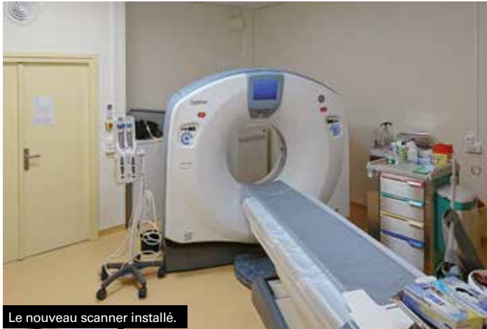
Le nouveau scanner installé.

Le dossier s'inscrivait comme un combat de longue date, la persévérance a porté ses fruits puisque le scanner tant attendu est arrivé au Centre Hospitalier de La Mure.