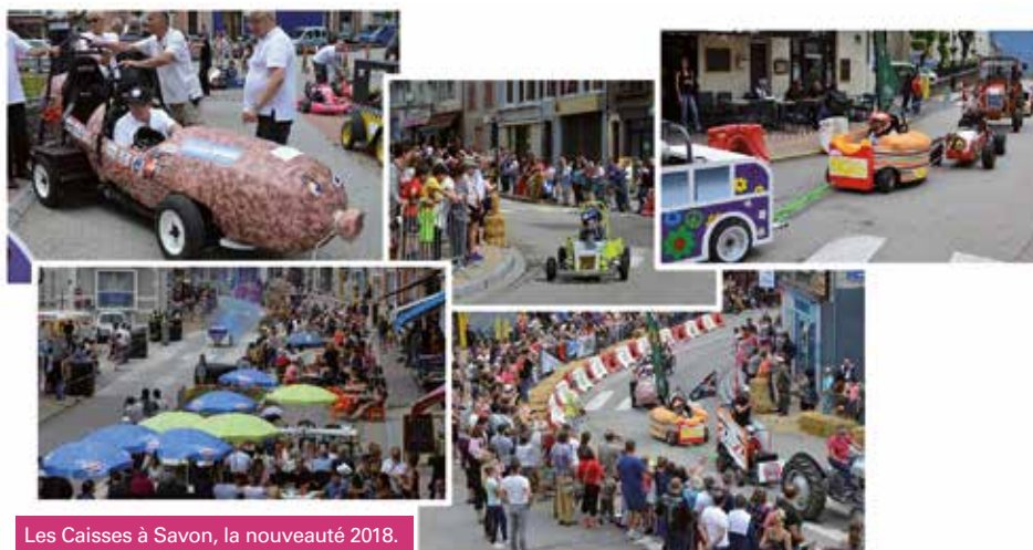
Les Caisses à Savon, la nouveauté 2018.

Le murçon biplace de la Confrérie du Murçon Matheysin a bien sûr fait sensation !! À l'issue des épreuves, un joli défilé de tracteurs remontait la piste pour achemi-