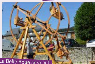
La Belle Roue sera là !