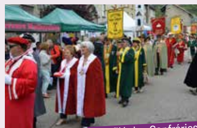
Défilé des Confréries